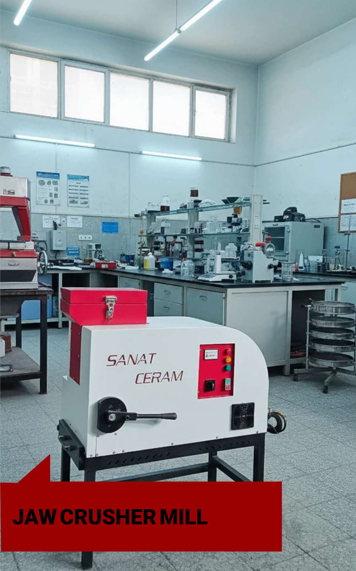
JAW CRUSHER MILL